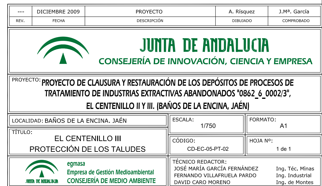
INSTALACIÓN DE FAJINAS EN LOS TALUDES