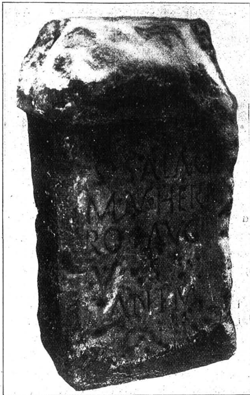
FIGURA 2. a

Si bien recuerdo, no envié al muy respetado Padre Fita más que una impresión de la aludida inscripción, y no una fotogra-